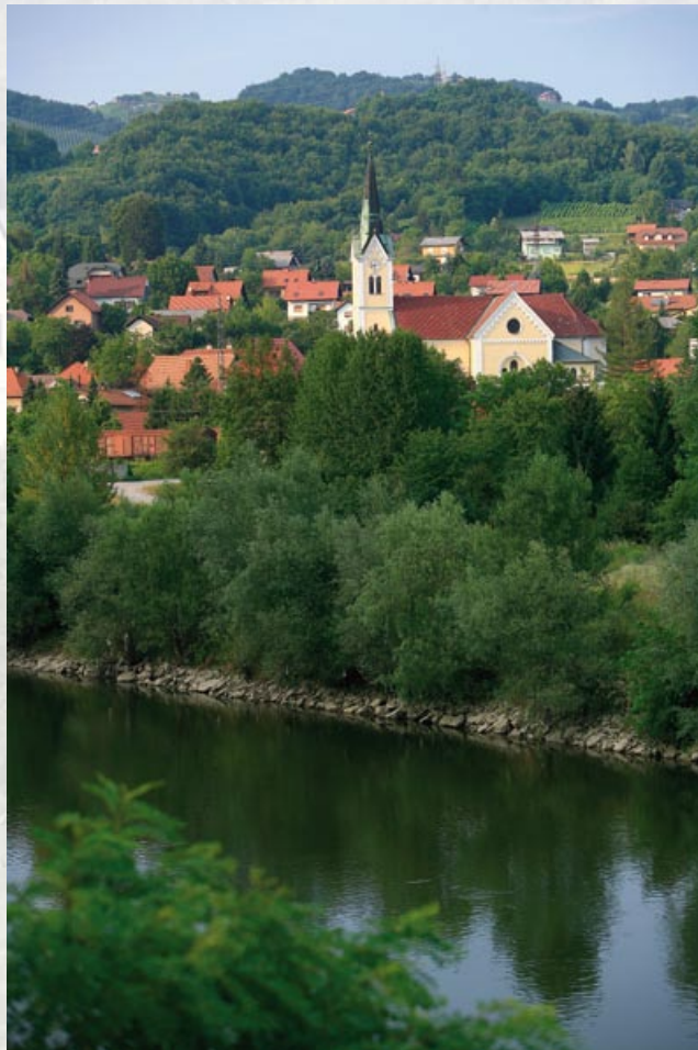
Cerkev sv. Ruperta