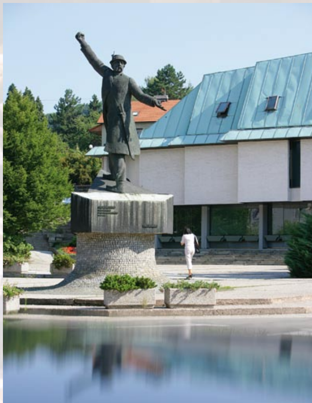
Kip Matije Gubca, foto Marinšek & Marinšek.

10 Kulturni dom Krško deluje kot samostojna ustanova na področju kulture in izobraževanja, prireja različne glasbene, gledališke in plesne dogodke, predvaja filme, organizira predavanja, likovne in druge razstave. Primeren je tudi za kongresni turizem, saj večnamenske in konferenčne dvorane (Velika dvorana, Mala dvorana, Klub KDK, Projektna soba) omogočajo poslovna in motivacijska srečanja, izobraževanja, team buildinge in delavnice. Kulturni dom je bil zgrajen ob 500-letnici mestnih pravic leta 1977 in je delo arhitekta Franca Filipčiča. V neposredni bližini se nahaja hotel City.