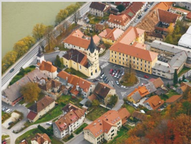
Hočevarjev trg