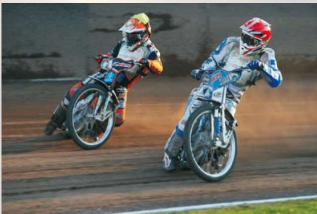
Spidvej dirka, foto Goran Rovan.

AMD Krško CKŽ 130 c 8270 Krško Telefonska št.: 07 492 53 02 violetta.freeland@nek.si www.speedwaykrsko.si