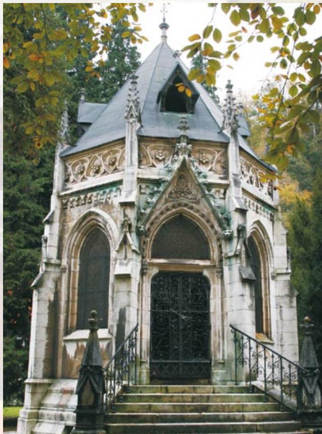
Hočevarjev mavzolej