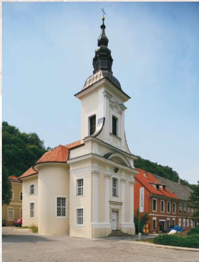
Galerija Krško, foto Marinšek & Marinšek.

2 Galerija Krško se nahaja v nekdanji cerkvi sv. Duha , zgrajeni leta 1777. Od leta 1939 je v njej nastajal mestni muzej, takrat je bila cerkev tudi odposvečena. Od leta 1966 pa je v njej mestna galerija, kjer prirejajo raznovrstne, predvsem s prostorom uglašene likovne razstave. Mestni muzej Krško in Galerija Krško sta enoti Kulturnega doma Krško in delujeta pod njegovim upravljanjem.