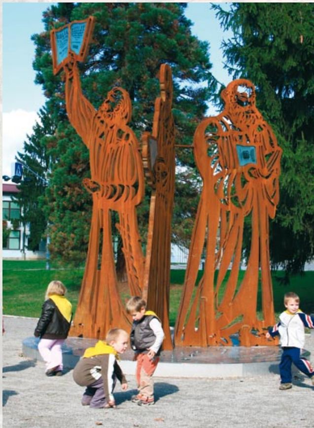
Spominski park Jurija Dalmatina, foto Goran Rovan.

11 V Spominskem parku Jurija Dalmatina stoji več kot štiri metre visoka skulptura, posvečena slovenskim reformatorjem iz obdobja protestantizma s posebnim poudarkom na vlogi Jurija Dalmatina, Primoža Trubarja in Adama Bohoriča. Ustvarja simbolni most med dvema bregovima mesta in vzpostavlja nov kakovosten mestni prostor in prostor srečevanj v gosto poseljenem urbanem območju.