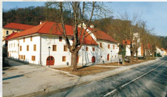
Valvasorjev kompleks

1 Ob vstopu v mestu Krško vas pozdravi Valvasorjev kompleks, sestavljen iz treh hiš, Valvasorjeve, Jarnovičeve in Kaplanove, ki arhitekturno pomenijo najkakovostnejši zgodovinski del mesta. Valvasorjeva hiša, poznorenesančna hiša iz leta 1609, je bila leta 1894 označena kot hiša, kjer naj bi zadnje obdobje življenja preživel slovit Valvasor (1641–1693). Danes vemo, da je njegova prava hiša od te oddaljena le nekaj deset metrov in je prav tako pomemben del mestne zgodovine, saj je v njej živel pisatelj, odvetnik in politik Janez Mencinger (1838–1912). Pred t. i. Valvasorjevo hišo so leta 1966 postavili