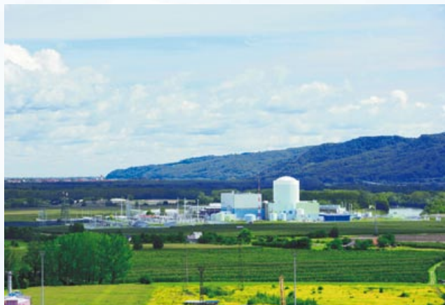
NEK, foto Marinšek & Marinšek.

13 Nuklearna elektrarna Krško (NEK) se nahaja v naselju Vrbina na levem bregu Save v neposredni bližini Krškega. Je edina nuklearna elektrarna v Sloveniji. V Kulturnem domu Krško je mogoč ogled filma o delovanju elektrarne in pogovor z njenim predstavnikom. NEK sprejema najavljene skupine obiskovalcev, polnoletni obiskovalci pa si lahko ogledajo tudi »klasični« del elektrarne.