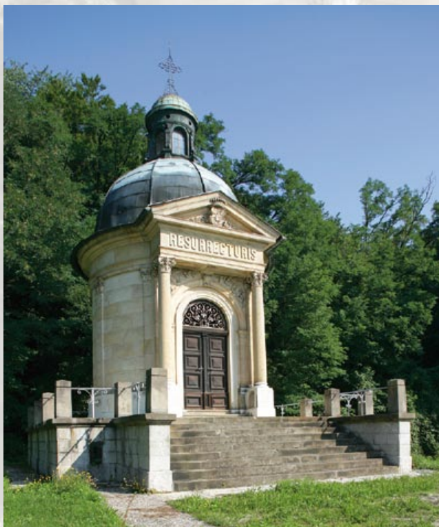
Mavzolej družine Auersperg