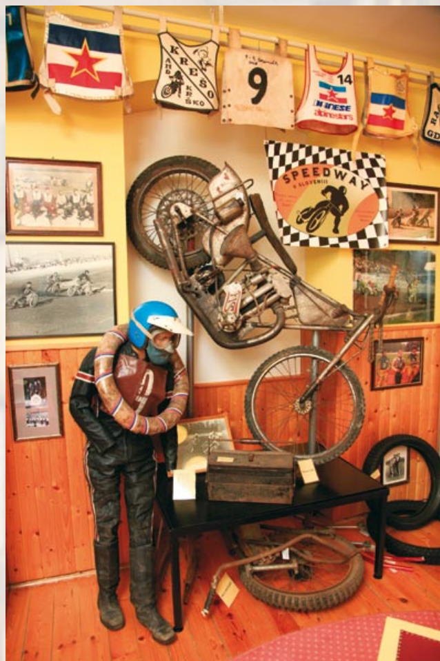
Spidvej soba.

7 Valvasorjeva knjižnica Krško deluje kot osrednja knjižnica v Občini Krško od leta 1965. Od leta 1988 se nahaja v kapucinskem samostanu. Skozi leta je postala sodobno kulturno, izobraževalno, informacijsko in socialno središče v lokalnem okolju, katere cilji so usmerjeni v zagotavljanje in uresničevanje knjižnične dejavnosti za vse generacije. V knjižnici skrbijo za razvoj domoznanske dejavnosti, aktivno sodelujejo v vseživljenjskem izobraževanju, pripravljajo različne bibliopedagoške dejavnosti za otroke in odrasle ter organizirajo kulturne prireditve za otroke, mladino in za odrasle. Pri izvajanju svojega poslanstva se povezujejo z izobraževalnimi in drugimi ustanovami, društvi in z organizacijami v lokalnem okolju. Njihova zbirka trenutno obsega okoli 145.000 enot gradiva. V knjižnici se nahaja tudi soba Spidvej , kjer je stalna posebna zbirka ali »muzej v malem« z naslovom Spidvej v Sloveniji . To je edina tovrstna javnodostopna zbirka v Sloveniji. V zbirki spidvej so razstavljeni številni predmeti – od motorja in opreme voznika do startnih števil, pokalov in priznanj ter marsikaj drugega. Predvsem pa se za vsakim predmetom v zbirki skriva zgodba o več kot polstoletni zgodovini slovenskega spidveja, posameznih voznikov in o preteklih dogodkih, ki so oblikovali ta poseben in zanimiv šport. Mogoč je tudi ogled kratkih filmov iz zgodovine slovenskega spidveja.