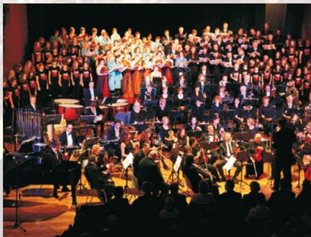
Prireditev v Kulturnem domu Krško, foto Goran Rovani.