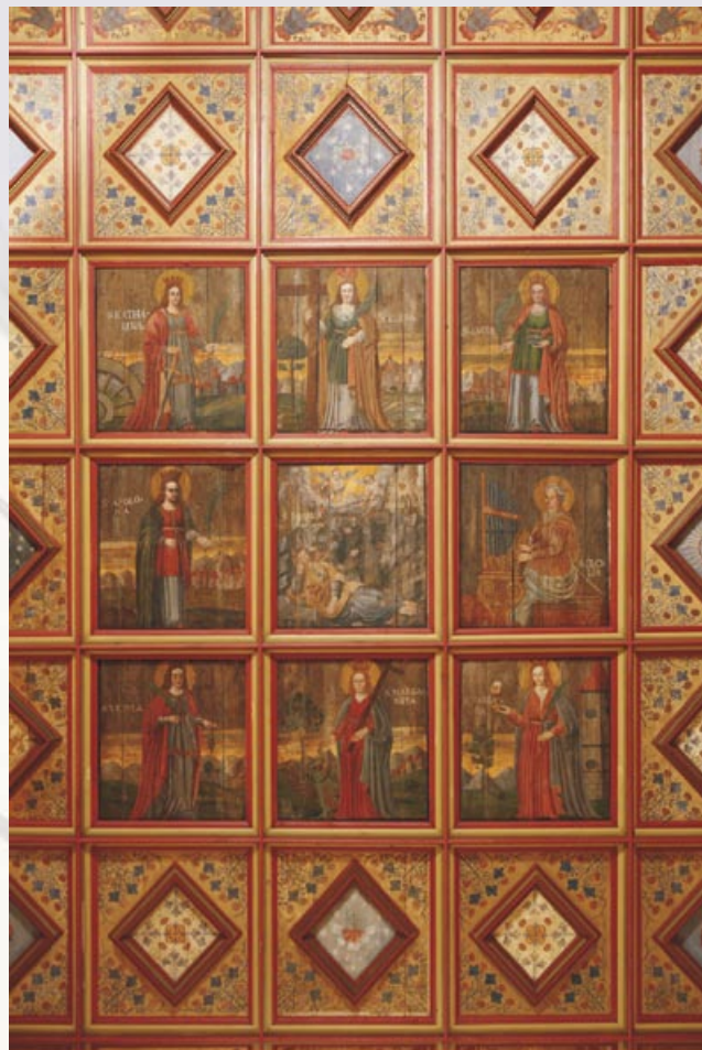
Kasetirani strop v cerkvi sv. Rozalije

8 Na hribu nad starim mestnim jedrom je med drevjem na majhni ravnici cerkev sv. Rozalije. Ime zavetnice pove, da gre za priprošnjico zoper kugo, ki je bila v 17. stoletju tudi v Krškem pogosta. V zahvalo, da ni več bojzani kuge, so postavili cerkev v čast sv. Rozaliji, v stranskih oltarjih pa se priporočili tudi drugemu varuhu zoper kugo, sv. Roku, in zavetniku brodnikov sv. Nikolaju. O tem je poročal tudi Valvasor v svoji Slavi in časti vojvodine