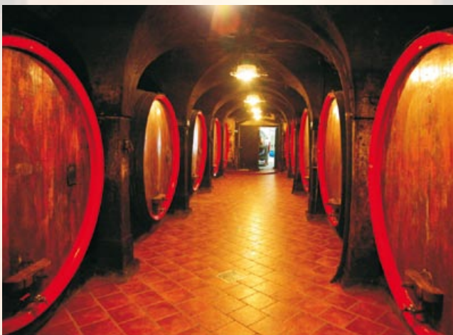
Vinska klet Krško.

15 Vinska klet Krško deluje v okviru Kmečke zadruge Krško kot največja organizacijsko proizvodna enota. Ima častitljivo zgodovino, saj njeni začetki segajo že v 16. in 17. stoletje, to pa je bila tudi klet gradu Šrajbarski Turn. Imajo lastne vinogradniške površine na Sremiču, kjer pridelujejo vrhunska vina, kot so: modra frankinja, zeleni silvanec, beli pinot, chardonnay, sauvignon, laški rizling, in sicer normalnih trgategv in tudi predikate. Najpomembnejša blagovna znamka Vinske kleti Krško je Cviček PTP.